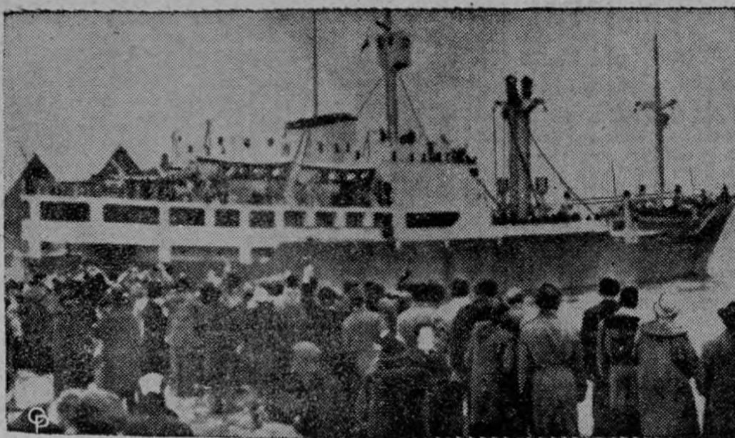
Las multitudes presencian la partida de Copenhague del Hans Hedtoft para su primer viaje a Groenlandia. El barco de carga y pasajeros danés con 95 personas a bordo había salido de Groenlandia en el viaje de regreso cuando chocó con un iceberg. La mar picada impidió a los barcos de salvamento acercarse a la nave averiada.