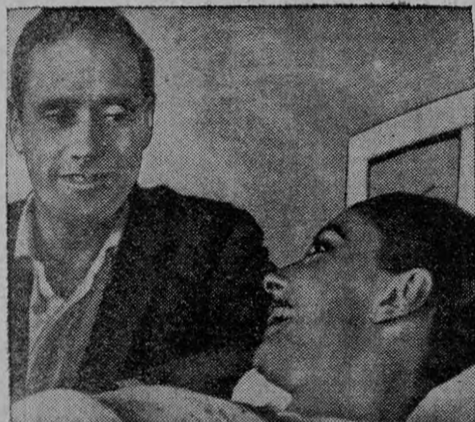
El actor Mel Ferrer consuela a su esposa la actriz Audrey Hepburn, en un hospital de Durango, México. La estrella de cine sufrió una lesión en la espalda al caer de un caballo mientras hacía una película de vaqueros. Estará hospitalizada 3 semanas